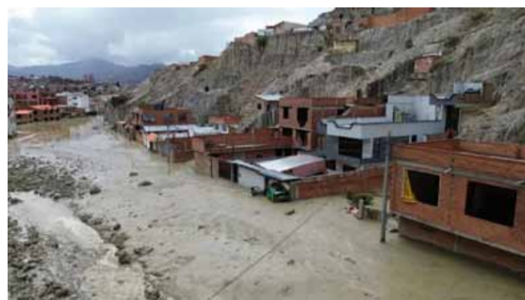
Los decesos. Ocurrieron en los departamentos de Chuquisaca (sur), Tarija (sur), Cochabamba (centro) y La Paz (oeste).

Actualmente, son afectados 13 municipios de siete de los nueve departamentos bolivianos: Beni (centro-norte), Chuquisaca, Cochabamba, La Paz, Potosí (suroeste), Santa Cruz (este) y Tarija, aunque hasta el momento