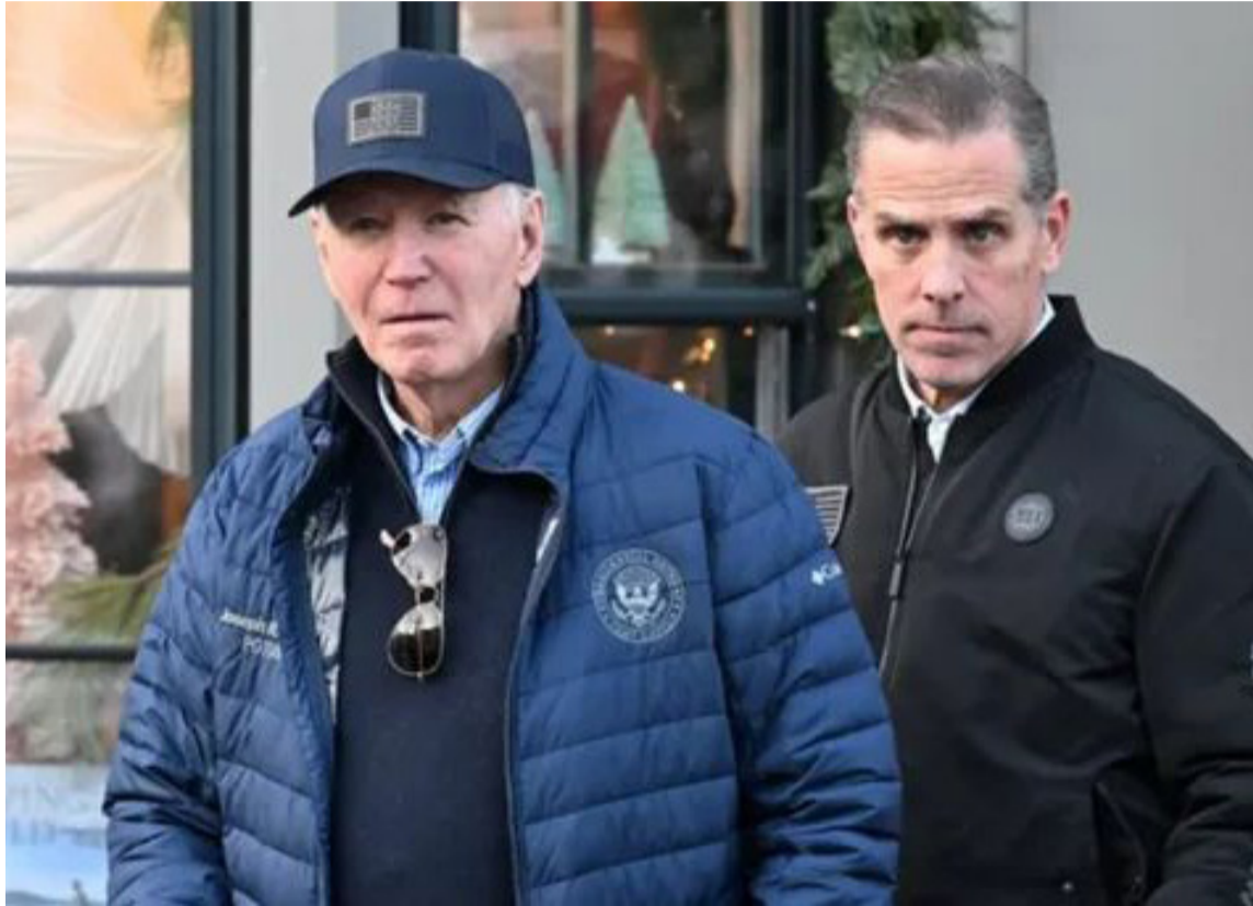
Cuestionado. Biden no cumplió con su promesa de no indultar a su hijo

Estaba procesado por consumo ilegal de drogas y posesión de armas