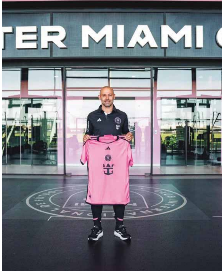
Mascherano. Será el entrenador de Inter Miami hasta 2027

Además, David Beckham elogió su determinación y conocimiento como claves para dirigir a "Las Garzas" en su camino hacia la élite del fútbol mundial. El de-