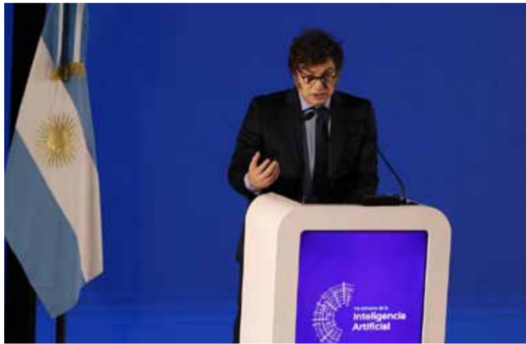
Postura. Milei habló en la Semana de la Inteligencia Artificial

Ante un auditorio colmado, que tuvo al jefe de Gabinete, Guillermo Francos, y al vocero presidencial, Manuel Adorni, en primera fila, el mandatario puntualizó: “Quién sabe las