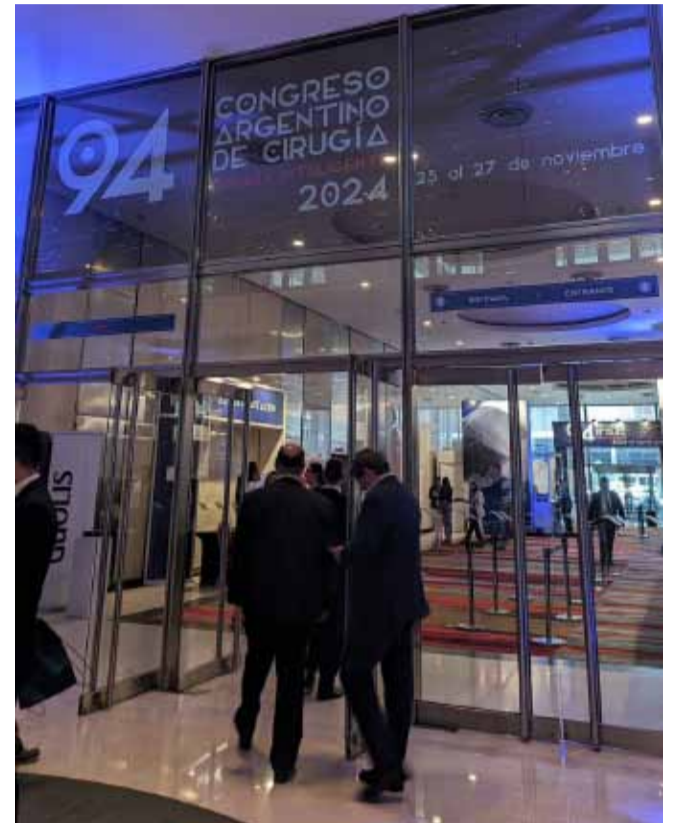
ejecutivo de una cirugía más eficaz, segura y equitativa.

El Congreso Argentino de Cirugía dejó en claro que el futuro de la disciplina está íntimamente ligado a la adopción de tecnología avanzada, posicionando a la innovación como el