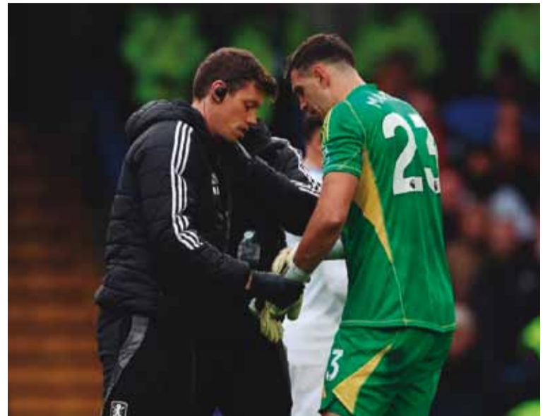
El Dibu Martínez. Sufrió una fractura en el meñique izquierdo

El arquero de la Selección argentina Emiliano "Dibu" Martínez sufrió una pequeña fractura en el dedo meñique de su mano izquierda durante la derrota de Aston Villa 3-0 ante el Chelsea. Aunque fue reemplazado en el entretiempo por molestias adicionales en la espalda, el cuerpo médico confirmó que su recuperación será rápida y podrá volver al arco en el corto plazo.