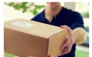
Puerta a puerta. El tope sube a US$ 3.000

ARCA avanzó sobre la medida implementada por la Secretaría de Industria y Comercio del Ministerio de Economía, que elevó el límite del valor FOB para la importación de mercaderías que, hasta ahora, tenían un tope de mil