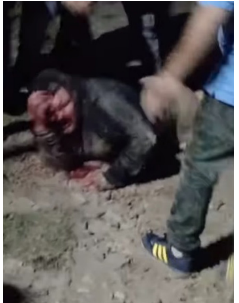
Heridos y daños. Durante la pueblada en Miramar

Una joven abusada, cuatro detenidos, un cabaña incendiada y siete policías heridos fue el resultado de un domingo de pueblada en la localidad bonaerense de Miramar.