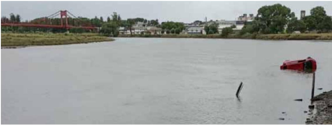
En el Río Quequén. Apareció el cuerpo de la joven mujer

Magalí Vera fue encontrada sin vida en el Río Quequén. Su pareja detenida