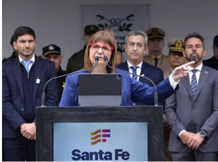
Amenazada. Patricia Bullrich, ministra de Seguridad

Se espera que entre este lunes o martes se realice una reunión: “Teníamos agenda para mañana, pero se decide adelantar para nosotros siempre es una prioridad el trabajo en conjunto