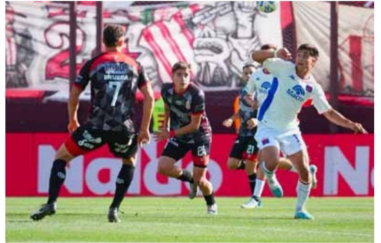
En La Fortaleza. El "Guapo" y el "Matador" empataron 0-0

Barracas Central y Tigre igualaron sin goles en el estadio Ciudad de Lanús en el marco de la vigésima quinta fecha de la Liga Profesional de Fútbol.