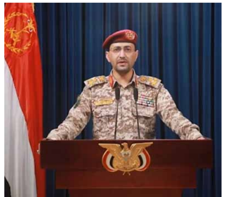
Portavoz rebelde. Así lo anunció Yahya Saree

Los hutíes de Yemen reivindicaron un ataque contra un destructor estadounidense y tres barcos de suministro en el mar Árabe, declaró el general Yahya Saree, portavoz del grupo rebelde.