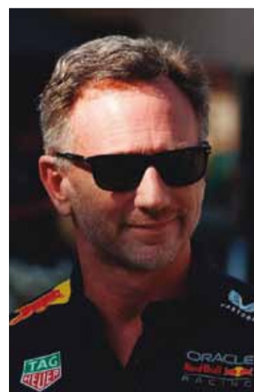
Pulgar abajo. Christian Horner, jefe de Red Bull en la Fórmula 1.

Por último, Horner se sumó a las declaraciones del asesor de Red Bull, Helmut Marko, quien también respaldó a los corredores que se encuentran